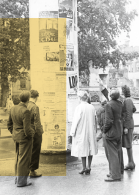
Wahlplakate an einer Litfaßsäule zur Kommunalwahl am 26. Mai 1946 in Frankfurt am Main.

und der von der US-Armee initiierten Gründung des Landes Hessen führt der Weg über den Vorbereitenden Verfassungsausschuss, die ersten freien Wahlen und die Verfassungberatende Landesversammlung hin zum erfolgreichen Verfassungsreferendum. „Als die Demokratie zurückkam“ bleibt aber nicht bei der Verfassungsgebung stehen, sondern verfolgt die Entwicklung der Demokratie in Hessen bis heute.