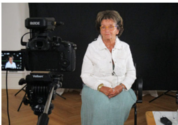
Dreharbeiten für ein Zeitzeugen-Interview im Rahmen des Dokumentationsprojektes „Fulda erzählt“

Noch lebende Zeitzeuginnen und Zeitzeugen aus der Stadt und Region Fulda wie auch aus ganz Hessen kommen in Videointerviews zu Wort, die im Rahmen des Dokumentationsprojekts „Fulda erzählt“ entstanden sind. Darin schildern sie ihre persönlichen Erfahrungen an die unmittelbaren Nachkriegsjahre, berichten vom Kriegsende und den ersten Begegnungen mit den Amerikanern.