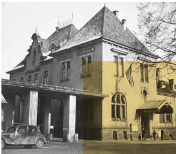
Das Amerika-Haus in der Rabanusstraße 19 in Fulda, 1949

Die separate Broschüre „Orte der Demokratie“ mit Übersichtskarte lädt zum Stadtrundgang ein und macht die Geschichte erlebbar.